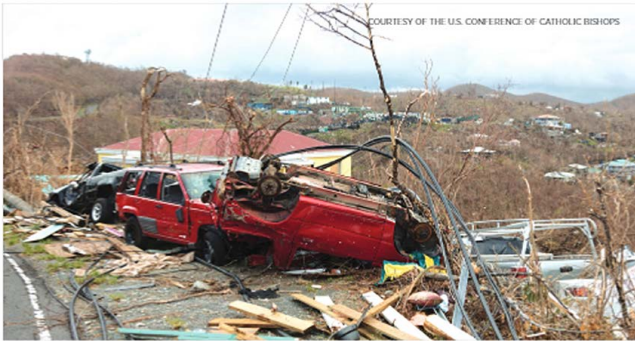
A scene of the devastation caused by Hurricane Irma in the U.S. Virgin Islands last fall.

E stimados Lectores: Suceden cosas asombrosas cuando las personas se unen para ayudar a nuestros hermanos y hermanas necesitados. Vimos esto en abril cuando muchos residentes de New Hampshire respondieron a la campaña de “A través de la tormenta: Ayudando a nuestros hermanos y hermanas en el Caribe” por el día de oración y solidaridad en todo el estado. Sus oraciones y su apoyo práctico brindaron asistencia crítica a los ciudadanos de Puerto Rico y las Islas Vírgenes de los Estados Unidos que aún sufren los devastadores efectos de los huracanes Irma y María.